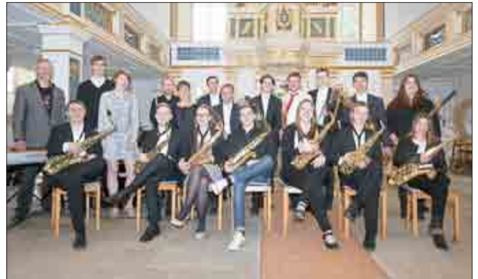
Die Bigband der Kreismusikschule „Louis Spohr“ Gotha zur Saisonöffnung des „Gräfenhainer Musiksommers 2017“