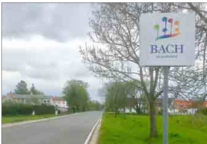
„Das neue Bach-Rad-Erlebnisrouten-Logo soll in Zukunft den kompletten Streckenverlauf neu markieren.“

Und auch die bestehende Bach-Rad-Erlebnisroute wird in diesem Jahr aufgewertet. Die Bemühungen des Bürgermeisters für eine neue Streckenführung in Richtung Schwabhausen waren leider trotz Gesprächen mit Vertretern der Bundeswehr noch nicht von Erfolg gekrönt. Hier wird aber nicht locker gelassen. Geplant ist nun eine komplett neue Beschilderung der Radroute, da es auf Grund des neuen Bach-Logos auch ein neues Bach-Rad-Erlebnisrouten-Logo gibt. Nach erfolgreicher Förderanfrage wurde jetzt ein entsprechender Fördermittelantrag auf den Weg gebracht. Noch in diesem Jahr soll die Umsetzung erfolgen.